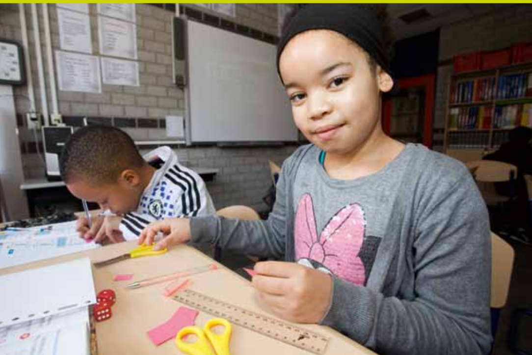
← 'Wie echt iets moois wil maken van zijn vak, moet in Rotterdam zijn' (Hugo de Jonge).